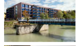
дом для пожилых людей со специально оборудованными для них небольшими квартирами Рфддушт в 2013 году