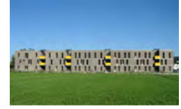
Жилое строение „Samer Mösl“ Зальцбург в 2006 году