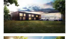
специально спроектированное здание, в котором располагаются исключительно служебные и деловые помещения фирм, организаций, частные бюро и пакагауз tuidwo austria Тугльхаф фль Цфддукууу в 2014 году