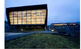
Спортивный парк Лизсфельд Линц в 2006 году