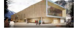
центр для народ с препяствие Бьеу Ошфртт в 2014 году