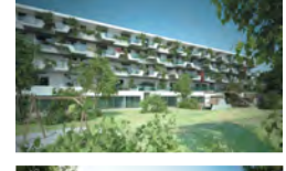
Жилое строение „Grüne Mitte Linz“ Дштн в 2013 году