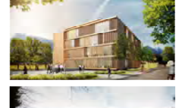
специально спроектированное здание, в котором располагаются исключительно служебные и деловые помещения фирм, организаций, частные бюро „Moserstraße“ Зальцбург в 2014 году