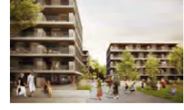
Жилое строение „Hummelkasernen“ Пкфн в 2013 году