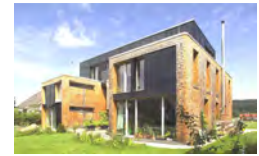
Пассивный дом oh123 Тальгау в 2002 году